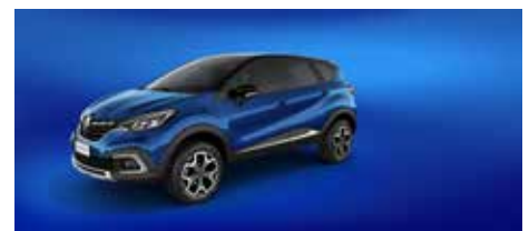
Azul Iron + Techo Negro (Nuevo)