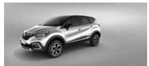
Gris Estrella + Techo Negro