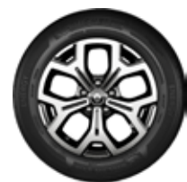
Rin 17" Aluminio diamantado "MALDIVES" (Iconic)