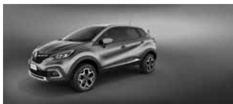
Gris Cassiopee + Techo Gris Estrella