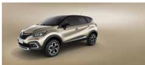
Beige Duna + Techo Negro (Nuevo)