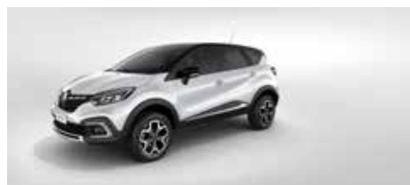
Blanco Glacial + Techo Negro