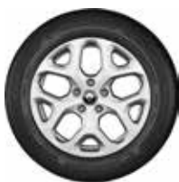
Rin 17" Aluminio (Zen)