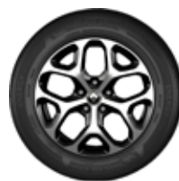
Rin 17" Aluminio (Intens)