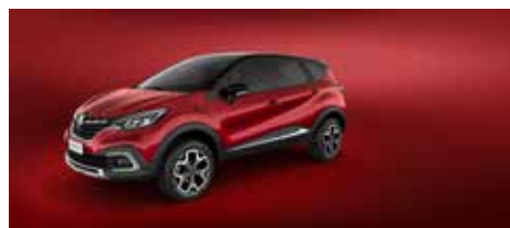
Rojo Fuego + Techo Negro